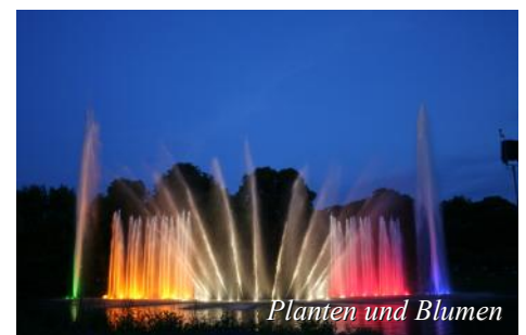
Planten und Blumen