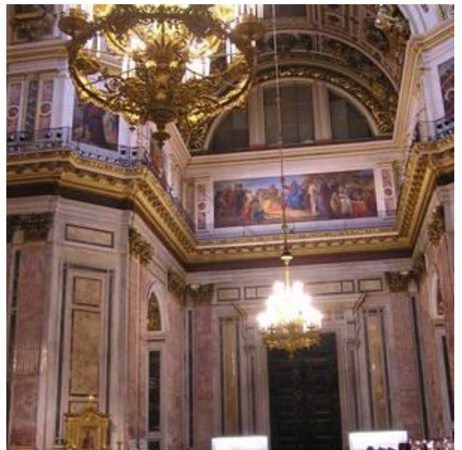
Vinterpalasset St. Petersburg